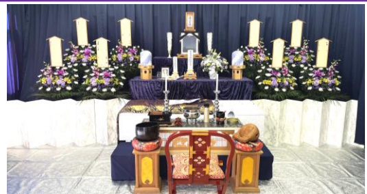
第 2 斎場での挙式例