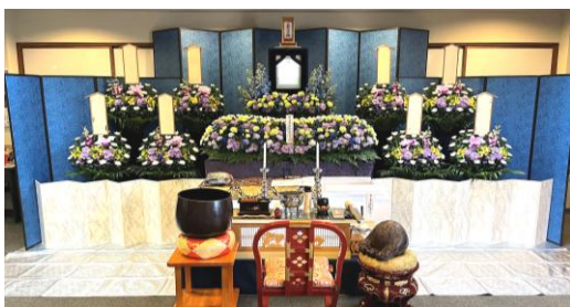
客殿 1 階での挙式例

法蔵院では、家族葬をはじめ、規模の大小にかかわらず、客殿・第二斎場にてご葬儀を勤めることが可能です。また、安心できる費用で、誠実に対応してくれる葬儀業者のご紹介も行っております。もちろん、お寺以外の式場で行う場合でも、信頼できる葬儀社をご紹介します。