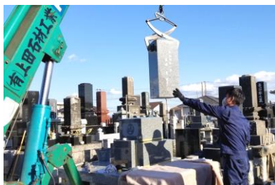
石材店による施行