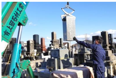
石材店による施行