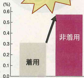
自転車乗用中のヘルメット着用状況別の致死率 (令和元年～令和5年合計/警察庁HPより) ※「致死率」とは、死傷者数に占める死者数の割合