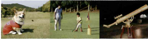
ワンちゃんも宿泊OK! (1日3棟限定) ゴルフコースで楽しく遊ぶ ゆったり星空観察

マザー牧場から車で10分(約4.6km)の場所にある、マザー牧場グランピングの第2弾！ワンちゃんと泊まれるプライベートドッグラン付きのテントもあります。心地よい芝生の上で「スナックゴルフ」に挑戦したり、夜は静かに星空を眺めたり、大人も子どもも真剣に遊べる秘密基地を存分にお楽しみください！