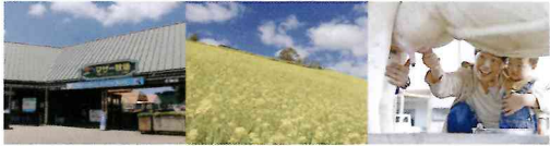
マザー牧場の中にある！ 牧場の景色を一望 早朝乳しほり体験

マザー牧場内に位置する、唯一無二の立地が特徴。宿泊後も車移動することなく、マザー牧場でたっぷり遊ぶことが出来ることも魅力のひとつです。夕方～夜～朝方へと表情を変える南房総の風光明媚な風景と共に、日中にマザー牧場とは違った新しい魅力をお楽しみください！