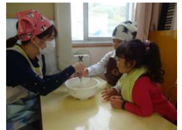
ホットケーキ作り おいしくなあれ