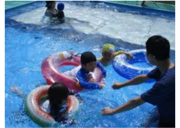
水遊び きもちいいね