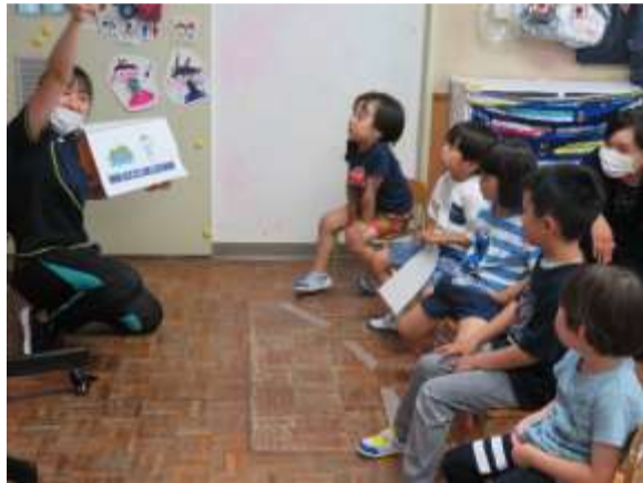
朝の集まり みんなで歌おう!