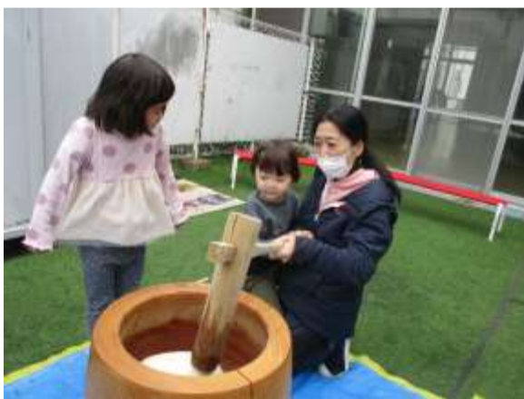
お餅つき べったんこ