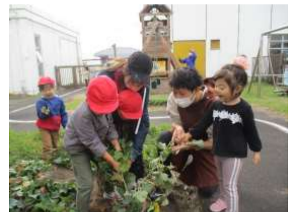
さつまい芋掘り 力を合わせてぬけるかな