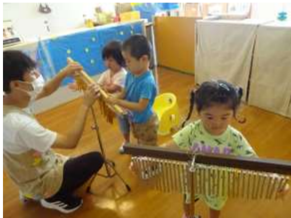
音楽遊び どんな音かな?