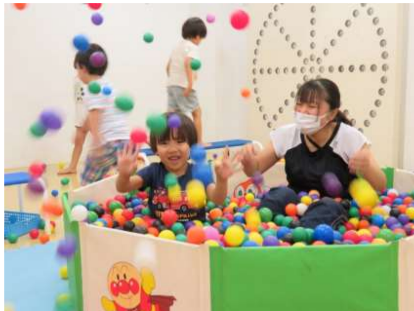
ボール遊び たのしいな