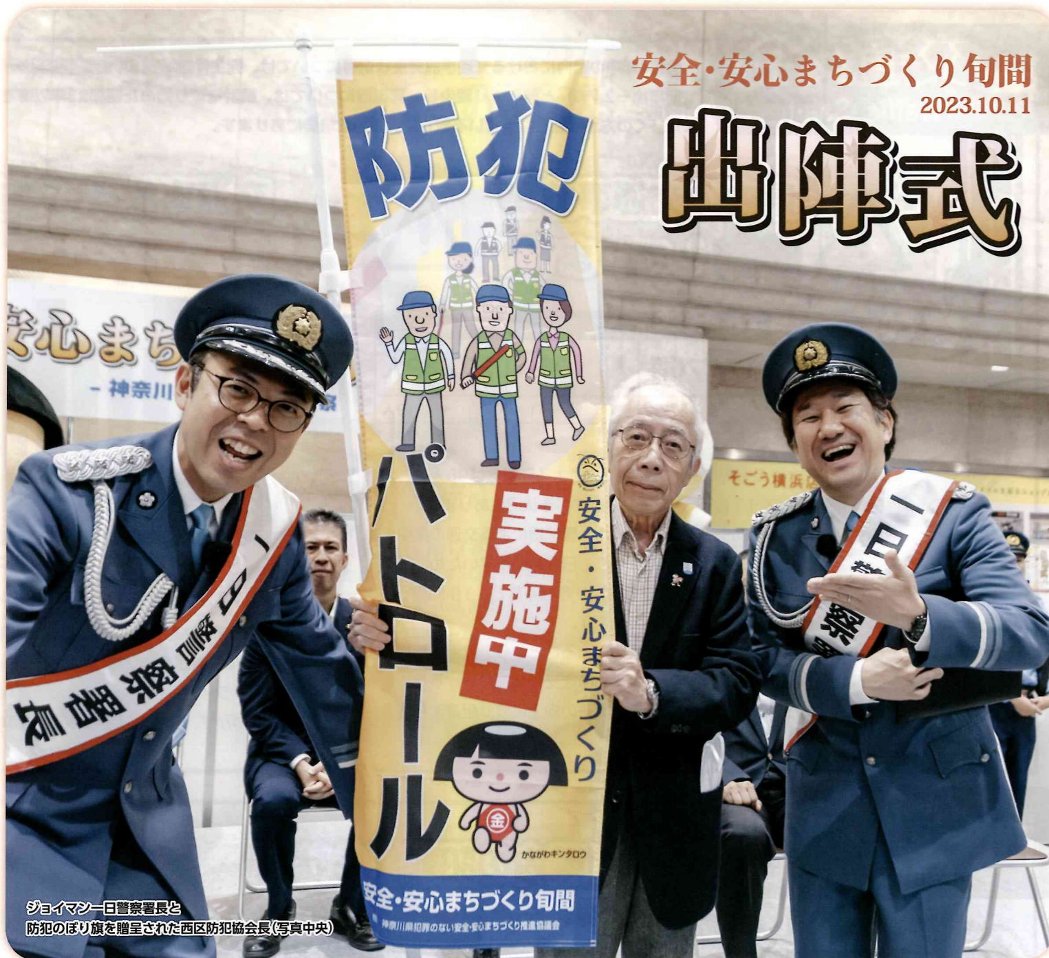
ジョイマン一日警察署長と防犯のほり旗を贈呈された西区防犯協会長(写真中央)