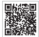
かながわ小児救急 ダイヤル

※新型コロナウイルスに関する相談は、神奈川県新型コロナウイルス感染症専用ダイヤルをご利用ください。