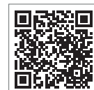
新型コロナウイルス 感染症専用ダイヤル