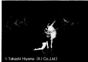
バレエ スターダンサーズ・バレエ団