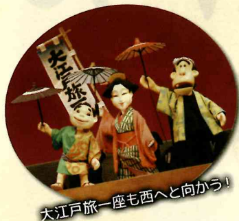
大江戸旅一座も西へと向かう!