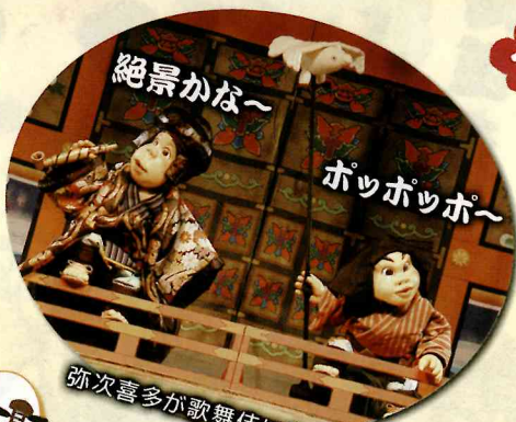
絶景かな〜 ポッポッポ〜 弥次喜多が歌舞伎に出演!?