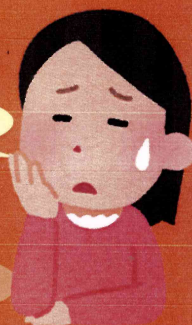
たとえば、子ども本人からのこんな相談