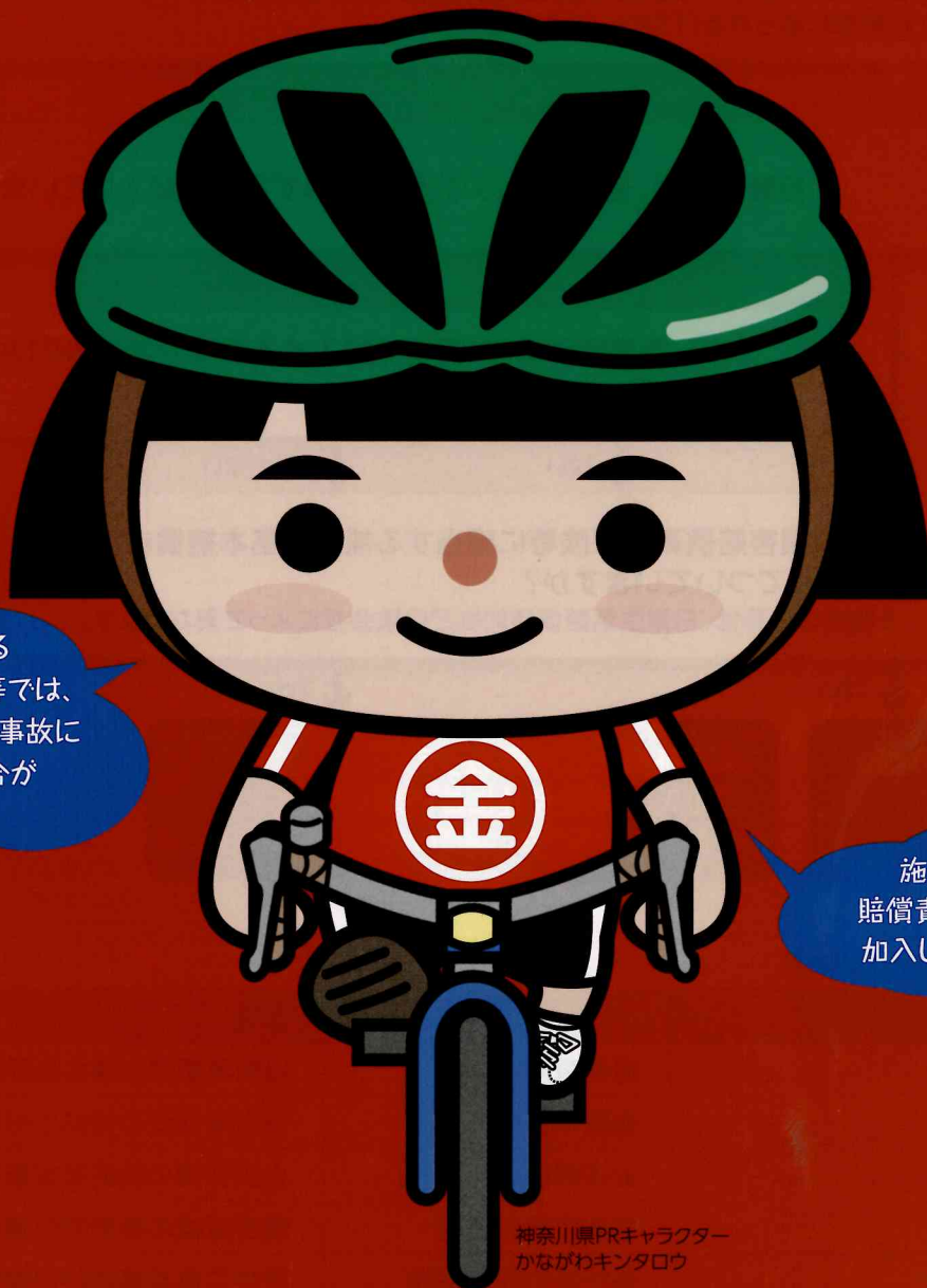
神奈川県PRキャラクター かながわキンタロウ

個人が加入する 個人賠償責任保険等では、 事業活動中の自転車事故に 対応できない場合が あります。