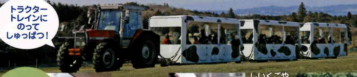
トラクタートレインにのってしゅっぱつ！ ワクワクレッツゴー！ トラクタートレインに乗って牧場の世界へ！ しくぐやでは、こうしがゴクゴクミルクをのむよ！ かしこいわんちゃん、「ぼくようけん」のおしごとみれる！