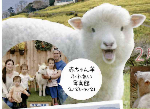
赤ちゃん羊ふかあ写真館 2/23~4/21

菜の花で一面が黄色に染まったら、マザー牧場の春の始まり！春は羊たちの出産シーズンだから、かわいい赤ちゃん羊にも会えるんです。